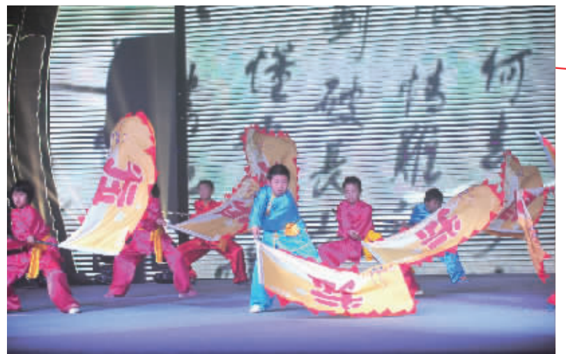
表演类一等奖 北仑区梅山小学 《水浒名拳》