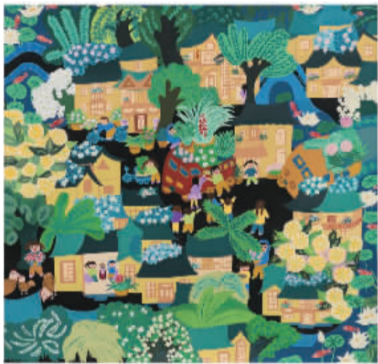
书画类一等奖 镇海区澥浦镇中心学校 郑烨 农民画《绿色家园》