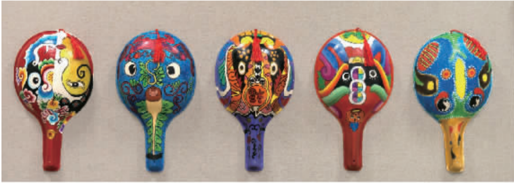
手工类一等奖 奉化市裘村镇中心小学 裴媛萌、沈洁 《手绘脸谱》