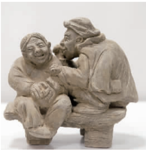
手工类三等奖 宁海县西店镇中心小学 阮科程 陶艺作品《夕阳红》