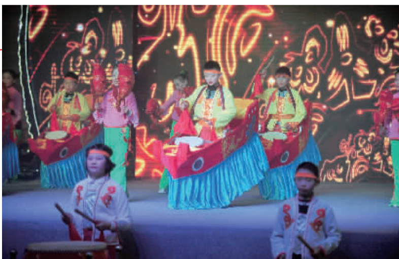
表演类一等奖 镇海区澥浦镇中心学校 《澥浦船鼓》