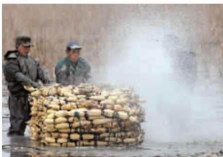
上岸前,经过高压水枪的冲洗,挖出的藕终于露出本来面目。