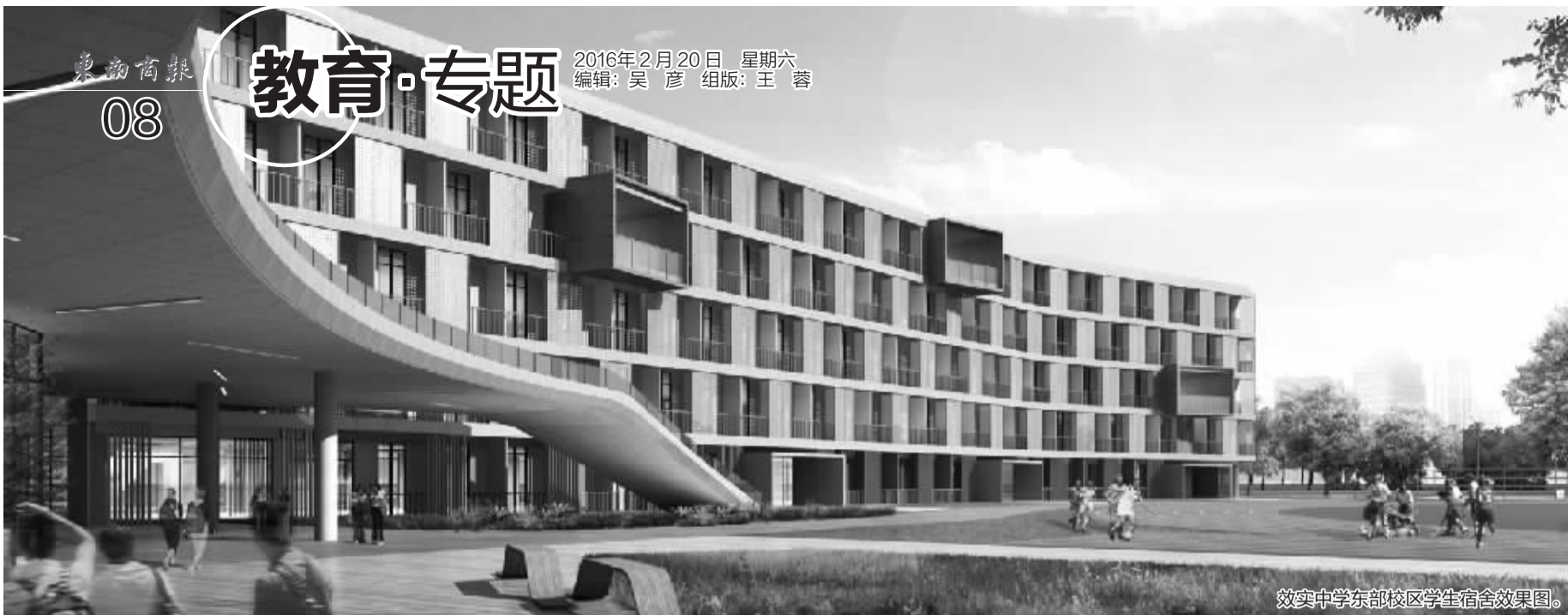
效实中学东部校区学生宿舍效果图。