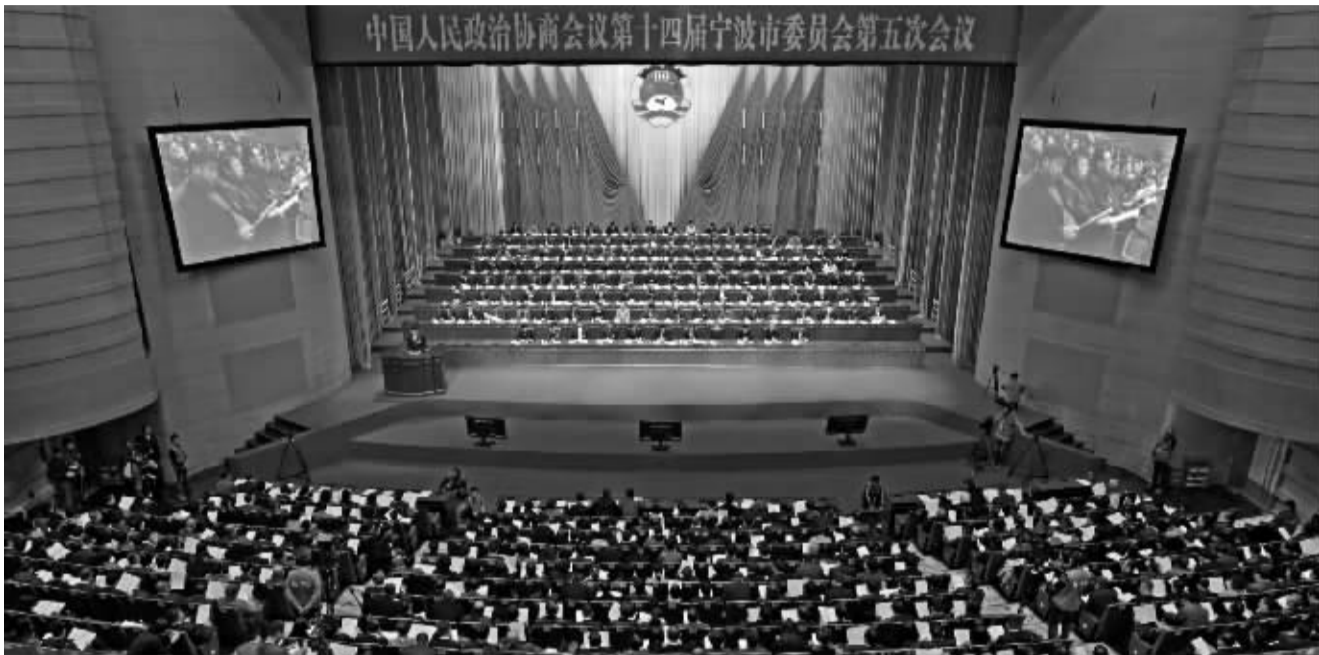
市政协十四届五次会议开幕。