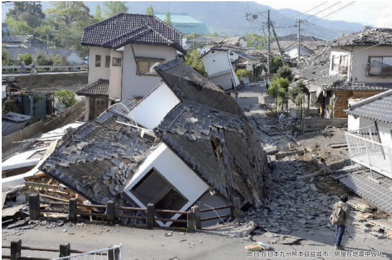
昨日,在日本九州熊本县益城市,房屋在地震中毁坏。