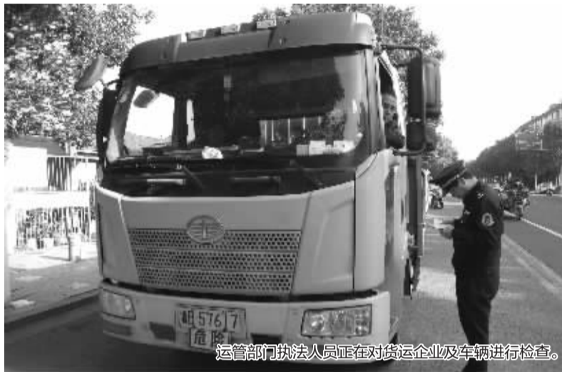
运管部门执法人员正在对货运企业及车辆进行检查。

对于行业管理部门来说,我市各级运管部门将督促运输企业强化危险货物运输车辆驾驶员的安全监管,建立健全安全管理组织机构和驾驶员安全监管制度,督促企业加强对车辆、从业人员的动态监管。并进一步完善应急救援体系,成立危险货物道路运输事故应急救援领导小组,健全相关信息报告、沟通协调、应急处理等机制;加强应急保障能力建设,做好各类运输事故的应急救援准备。