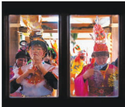
《渔民的节日》系列作品之一 石春光