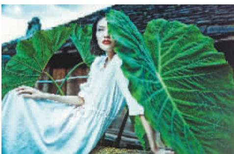
《镜无止境》系列作品之一 牛也