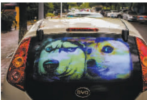
《诙谐街头》系列作品之一 肖冯斌