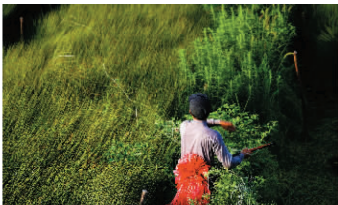
《江口一蔺草客》系列作品之一 蒋成