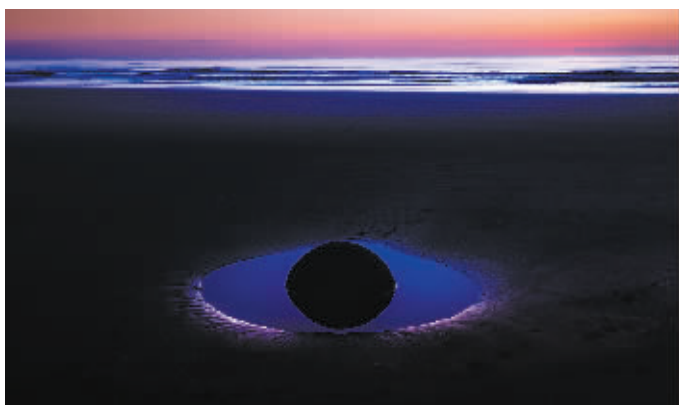
《寄情山河》系列作品之一 邱国良