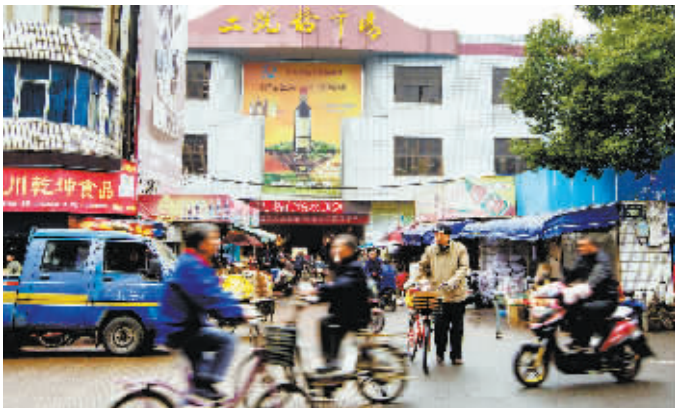
《最后的二号桥市场》系列作品之一 钱峰