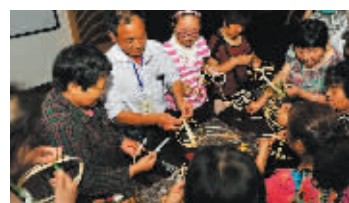
横溪彩灯扎制培训班。