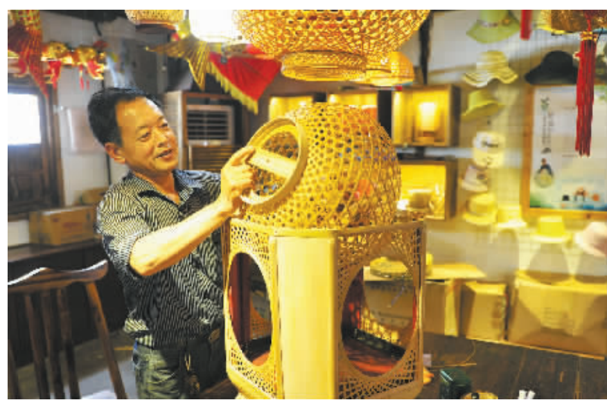
已经初步完成扎制的彩灯,接下来还要进行组装等工序。