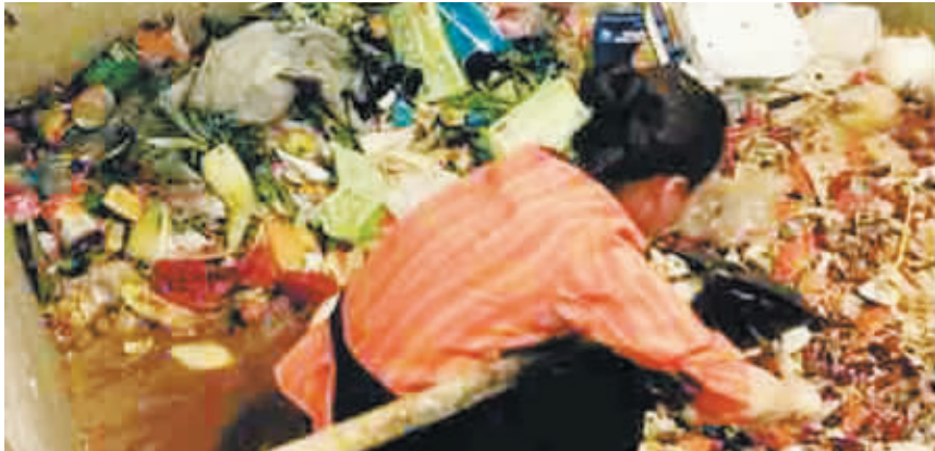
服务员找牙套现场。(网友“天打岩人生”网上贴图)

“今晚在开元名都吃自助餐，不慎丢失了牙套，美丽的服务员小姐耐心地帮助我们，牙套找回来了，这种行为值得称赞！”昨日凌晨，网友“天打岩人生”在我市一家本地论坛发帖，短短一句话加上4张现场照片，迅速获得上万名网友的围观。