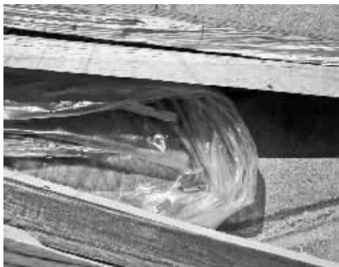
地板表面有很多小孔。