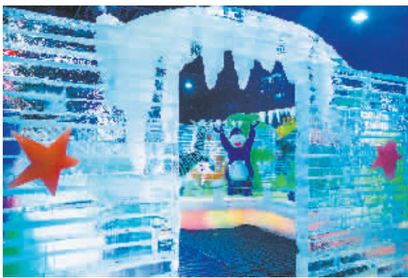
马达加斯加主题冰雕