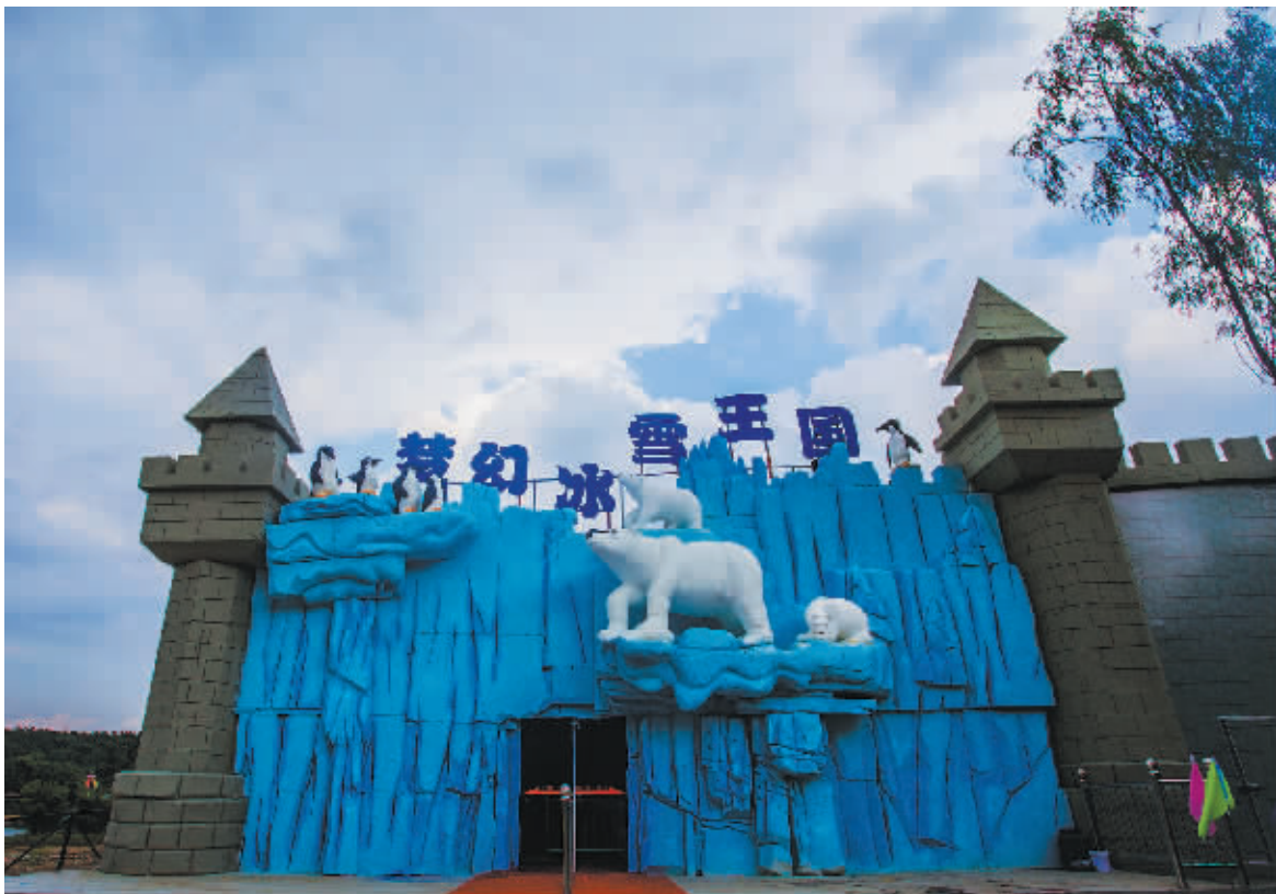
雅戈尔动物园新添的“梦幻冰雪王国”游玩项目外景。