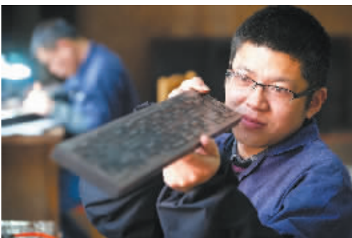
初步形成的雕件还要反复修正。