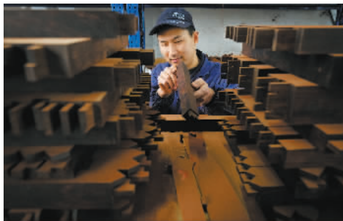
这里的家具都是榫卯结构。