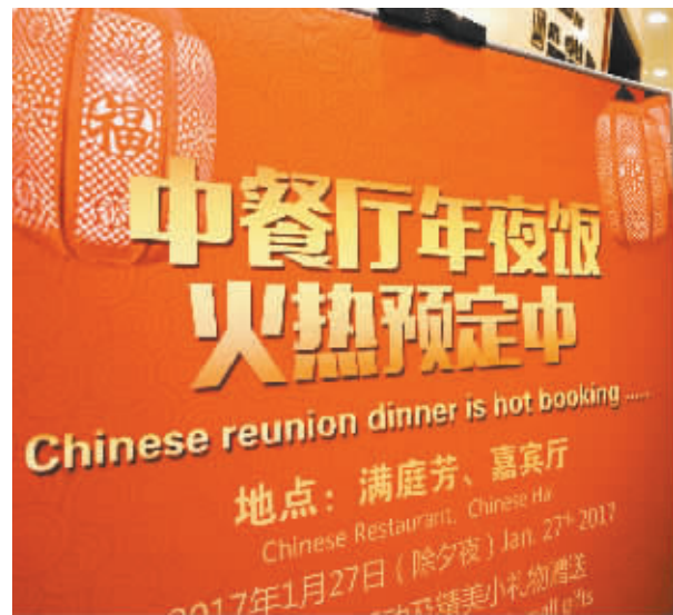
一酒店门口摆放的年夜饭预订招牌。

据业内人士调研市场获悉，今年不少高端酒店纷纷创新营销方式，推出不同档次、不同层面的家