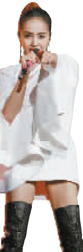
“丝路春晚”的录制中,蔡依林的数首经典歌曲引发全场大合唱。

作为今年所有卫视中唯一的主题性春晚,“丝路春晚”剧组此前表示,将把“一带一路”战略构想用音律、舞姿、影像等多种艺术形式生动呈现,晚会将围绕“地方特色,丝路风情,中国气派,国际表达”展开。除了贯穿全场的“丝路线索”、奇趣逗乐的小品《丝路上有你》、中外结合的歌曲《从起点到终点》等节目外,“春晚常客”李玉刚特别为丝路春晚打造了一个原创全息歌舞节目。在这个名为《霓裳飞花》的节目中,李玉刚以他独特的方式,用声音与肢体展现一幕“霓裳幻彩”长卷,服装绚丽,彩绸飞舞,是整台演出的视觉爆点。据悉,在录制过程中,这个节目令现场掌声雷动。