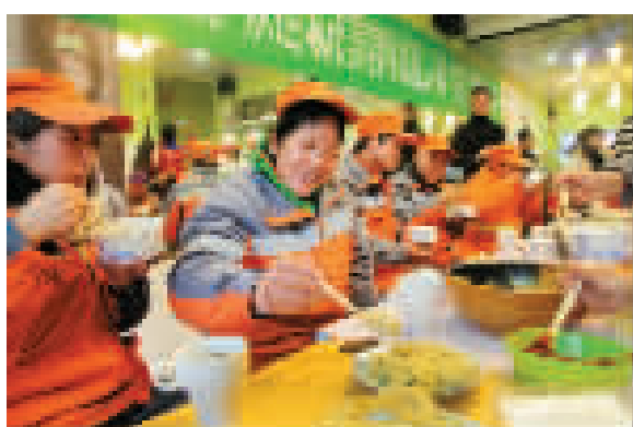
环卫工人围坐在一块享用特殊的年夜饭。

另据调查统计，我市上月仔猪与白条肉比价1.05:1，比全省1.37:1低23.36%。随着气温走低及春节假日效应刺激，生猪需求将呈增长趋势。但是南方多省份持续推进的环境整治行动，带动生猪产能下降的影响逐渐显现，国内生猪供给将呈下降趋势。预计后期我市生猪价格将呈振荡上行态势，本月份尤其是在春节期间，生猪生产成本收益或将处于红色预警区域。