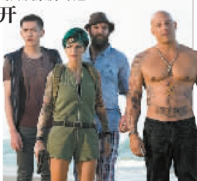
范·迪塞尔(右)和他的团队

采访时谈到:“当我们面向全世界甄选角色的时候,我就知道这部电影注定是不平凡的。”而与他首次合作的甄子丹也表示:“我们拍戏很开心,经常一起开玩笑,还互相拥抱,就像一个大家庭。”作为一部动作戏过硬的好莱坞大片,电影纳入了大量极限运