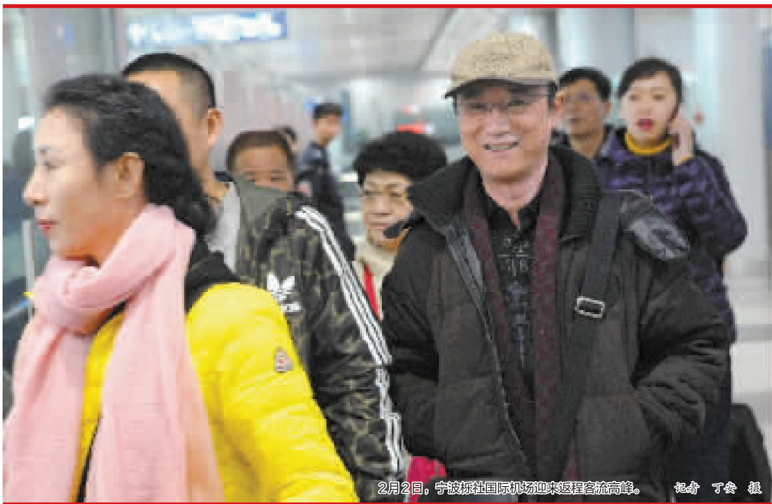
2月2日,宁波栎社国际机场迎来返程客流高峰。