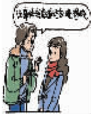
钱元平 辑录 任山葳 配图

词条: 真道话 解释: 确实,真的。 例句: 该事体我真道话勿晓得哦。[这事我确实不知道的。]