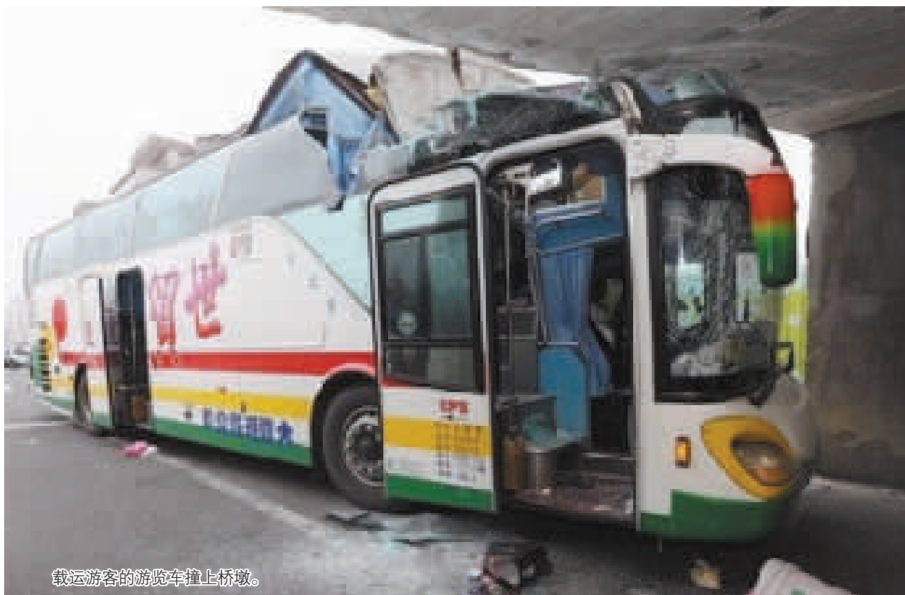
载运游客的游览车撞上桥墩。

商报讯(记者 谢舒奕)据相关媒体昨天中午报道,当日10时许,台湾发生了一起载运宁波游客的游览车自撞桥墩车祸,有多人受伤。对此,记者立即向有关方面进行了采访核实。