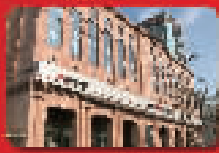
中国工商银行宁波市分行营业部 地址：宁波市海曙区中山西路210号