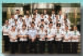
宁波市分行甬东支行营业部荣获“2016年度市民满意文明示范网点”称号

宁波市分行甬东支行营业部荣获“2016年度市民满意文明示范网点”称号。该网点始终坚持以客户为中心,不断提升服务品质,优化服务流程,为客户提供温馨、高效、优惠、安全的金融服务。近年来,该网点积极开展各类普惠金融活动,持续提升客户满意度,赢得了广大客户的认可和好评。