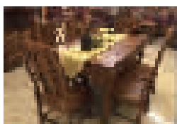
餐桌7件套(刺猬紫檀) 原价:26800元 特价:7800元