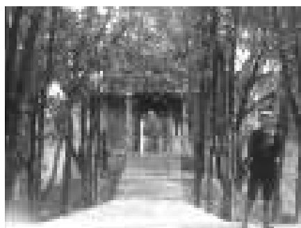
武岭头悠闲的治安警察。