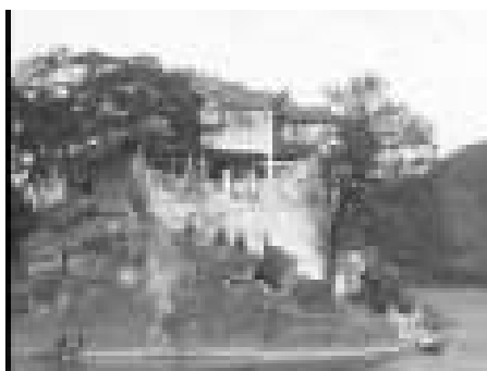
恬静的武岭头风景。