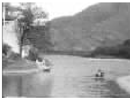
游客在溪口剡溪里泛舟。