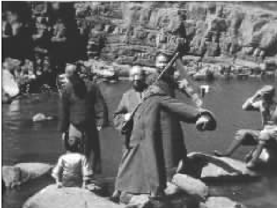
旅行团部分游客在潭边小憩。

短短的8分钟时间,尽显当时雪窦山的美景、奉化溪口的风土人情。奉化档案馆的专家考证,这段视频大概是在1931年三四月份拍摄的,且只是原始视频的一部分。由于时日已久,大部分视频资料已经无法读出,仅保留下奉化的一段记录。拍摄这段视频的友声旅行团是民国时期上海乃至全国最大的非营