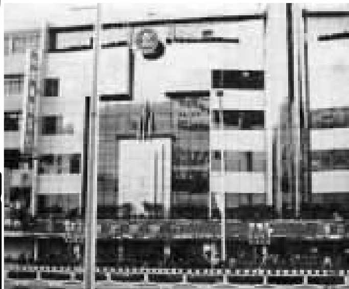
昔日位于中山东路的绿洲珠宝行。