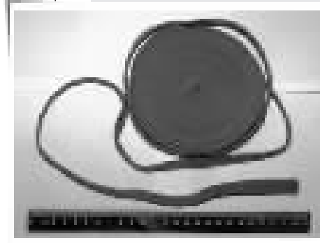
1995年宁波案现场遗留的军用背包绳。

经过努力，警方获取了2007年11月诸暨市抢劫珠宝店(未遂)案件重要关系人的视频监控录像，并将录像公布于众。