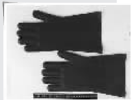
1995年宁波案现场遗留的橡胶绝缘手套(江苏常熟1995年4月生产)。