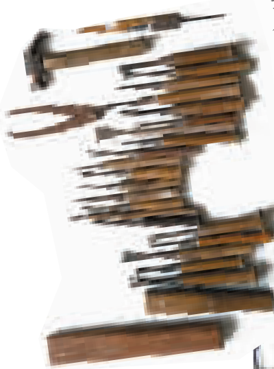
雕刻用的部分工具