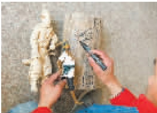
先用面塑制作造型，再在樟木上画线条。