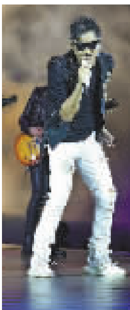
孙楠获亚洲影响力特别荣誉大奖