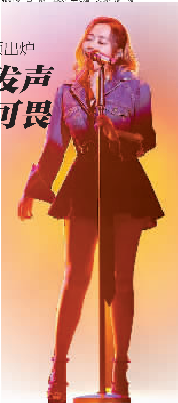
张靓颖获内地最佳女歌手奖