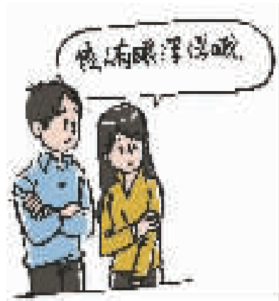
钱元平 辑录 任山威 配图