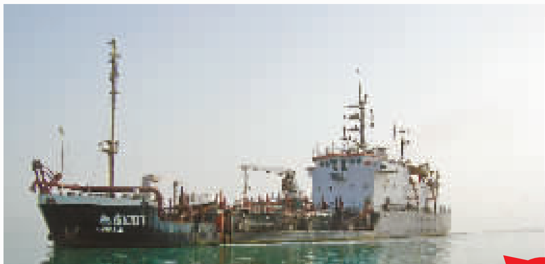
▲2002年5月,中交上航局航道建设有限公司(驻地在宁波镇海)航浚1007轮,启程赴巴基斯坦参加国家援建瓜达尔港工程建设。(资料图片)