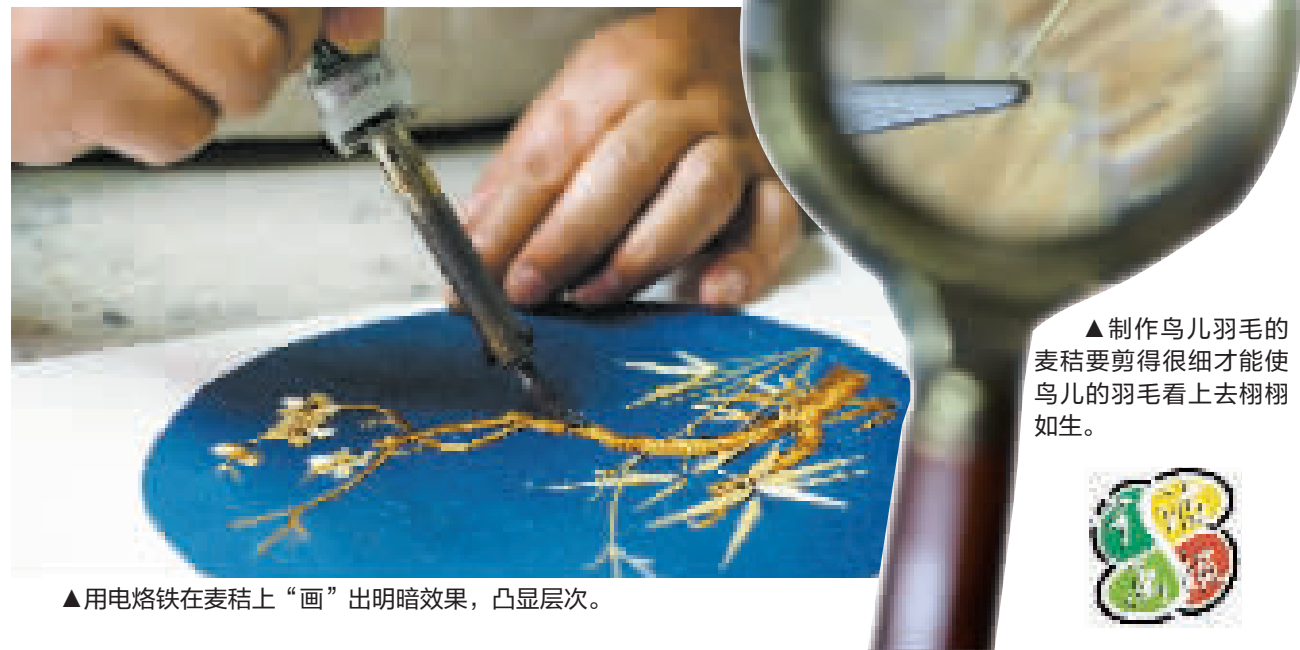
▲制作鸟儿羽毛的麦秸要剪得很细才能使鸟儿的羽毛看上去栩栩如生。