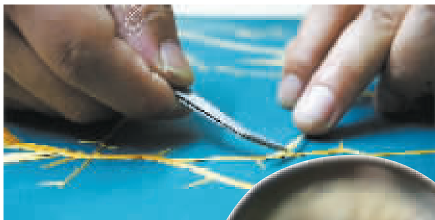
▲与其说是作画,不如是一种拼贴艺术。