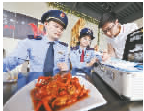
近日，鄞州区市场督管局明楼所开展了餐饮服务环节小龙虾集中专项监督检查。图为该所人员利用罍粟壳快速检测卡对集盒美食街内销售的龙虾进行快速检测。