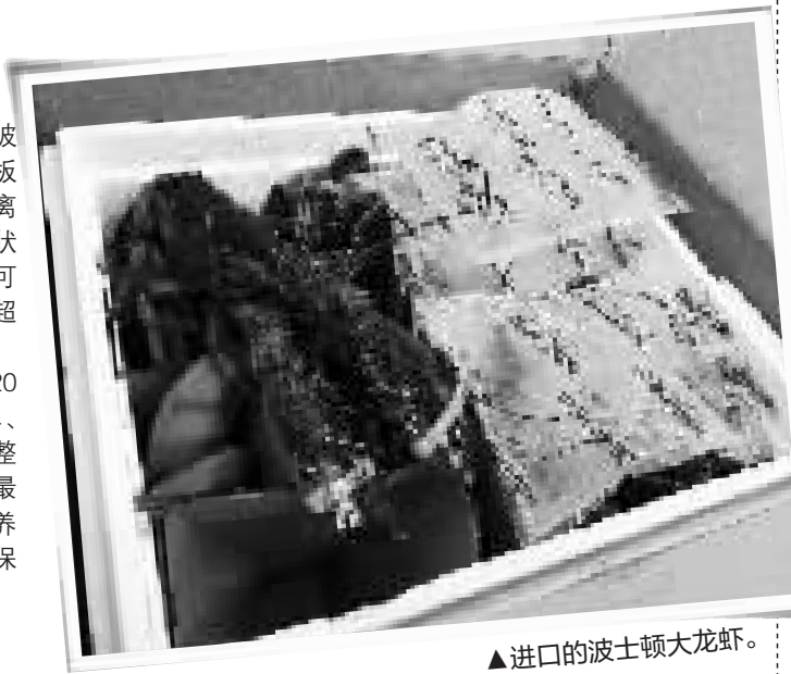
▲进口的波士顿大龙虾。

从美国起飞到宁波花去20多个小时，从航班落地、接单、出仓、施封、运输、最终入库，整个监管过程才用了4小时，最后进入慈溪出口加工区的暂养池，只用了不到30个小时，保证每只龙虾都十分鲜活。