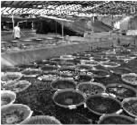
我市培育的大批虎斑乌贼鱼苗。