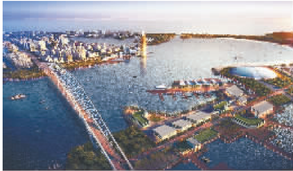
宁波梅山海洋金融小镇效果图。

元。项目主要来自宁波、舟山、绍兴和金华。从签约项目的产业结构分析,二产项目6个,总投资147.7亿元,占35.1%,主要集中在基础设施、汽车零部件制造、飞行器制造等行业;三产项目7个,总投资273.4亿元,占比64.9%,主要集中在产业综合体、物流、高端养老等行业。