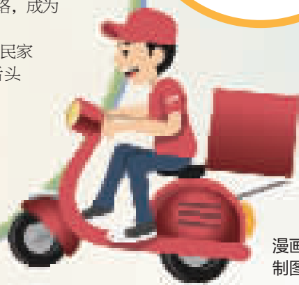
漫画 张丽珍 制图 雷林燕