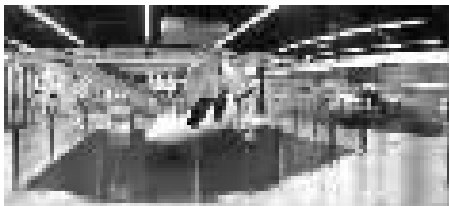
图为苏宁易购门店飞机卖场专区

苏宁的门店都卖什么?空调、冰箱、电视、手机、电脑、百货等等,而除了这些常见商品,苏宁竟然开始卖飞机了,并且已经成功卖出了2架价值百万元以上的飞机。