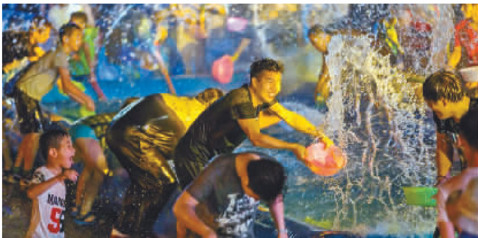
游客夜间在北仑凤凰山海港乐园泼水狂欢。