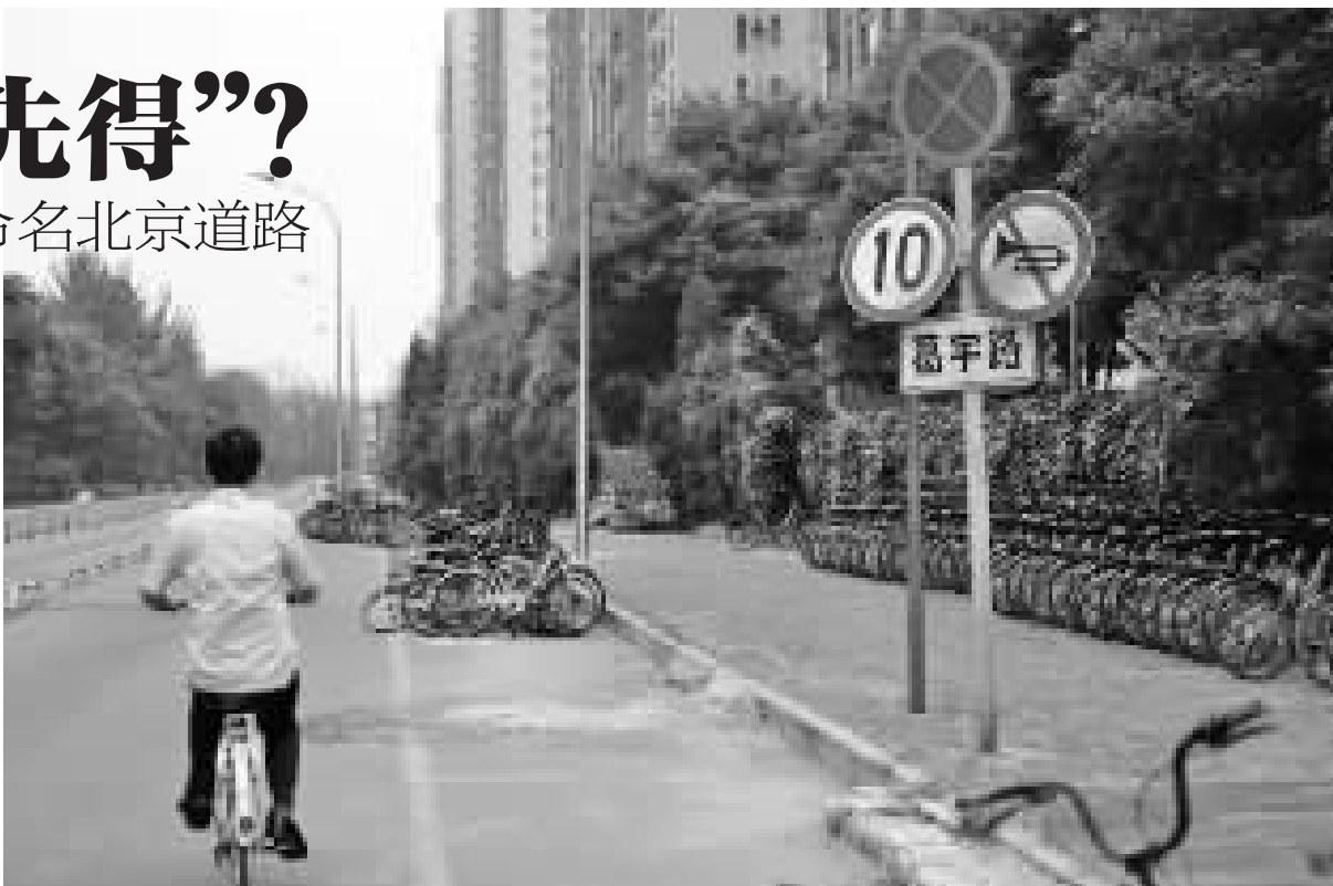
出现在无名路上的“葛宇路”路牌。

随后，高德地图、百度地图等地图收录了这条道路。前天，记者从北京朝阳区双井街道办事处了解到，这条道路目前其实还没有正式被命名。北京市规划委员会工作人员称，市民不可以私自命名道路，应由专门的地名办公室负责道路取名。朝阳区市政市容委表示，个人不能随意制作并悬挂路牌。另外根据《北京市地名管理办法》相关规定，一般不以人名作地名。