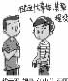
钱元平 辑录 任山葳 配图

词条:章程 解释:主见,主意。 例句:碰到大事体,其章程没类。[碰到大事,他没主意了。]