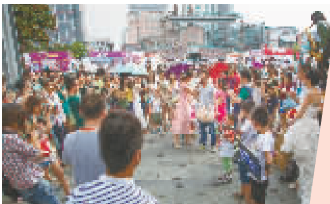
我爱你音量比赛 摄于2014年