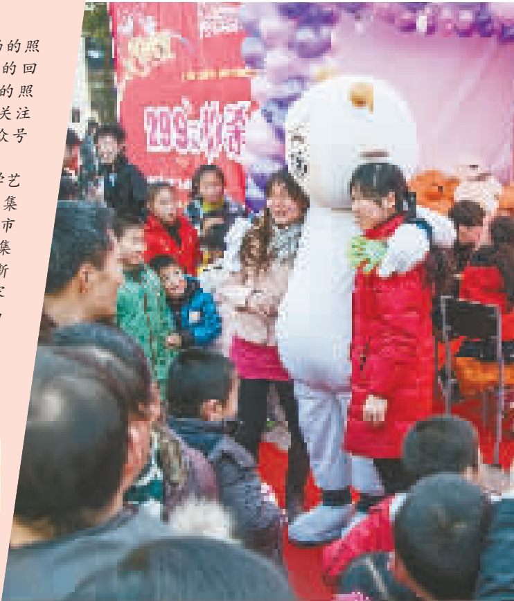
元旦嘉年华 摄于2011年