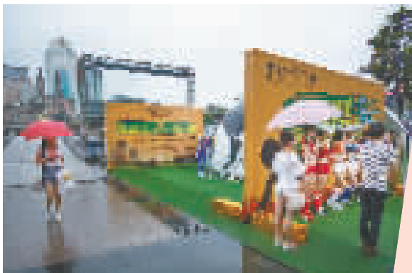
世界杯足球宝贝 摄于2014年