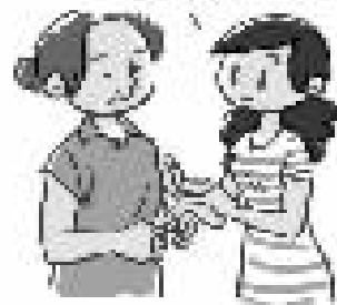
钱元平 辑录 仕山威 配图