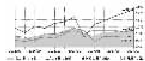
2016年7月—2017年7月公路货运市场景气指数变化图

7月,宁波市公路货物运输价格指数有力回升,报收980.52点,环比上涨1.22个百分点,同比增加2.19个百分点。其中,集装箱和普货整车运输价格指数环比基本持平,危化品运输价格指数持续上升。公路货物运输市场景气指数继续上扬,报收1041.72点,环比上升1.26个百分点,同比上涨8.22个百分点,其中,普货整车运输市场景气指数小幅上涨,集装箱运输市场景气指数稳中向上,危化品运输市场景气指数继续走高。