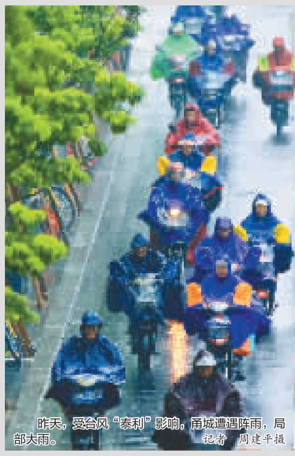
昨天, 受台风“泰利”影响, 甬城遭遇阵雨, 局部大雨。

从目前的预报来看, “泰利”带来的降水影响预计持续到今天下午, 带来的大风影响预计将维持到16日。