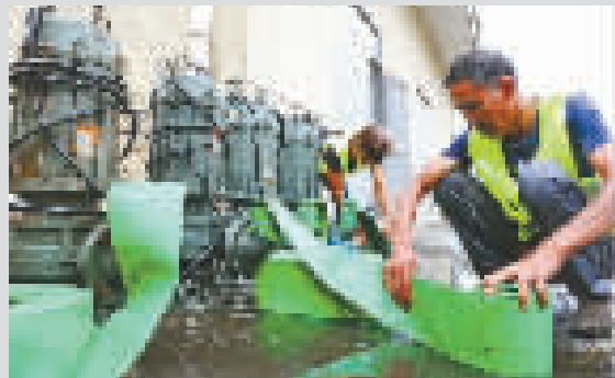
昨天下午, 桃江雨水泵站内工作人员忙着准备抽水泵、沙袋等防台物资。