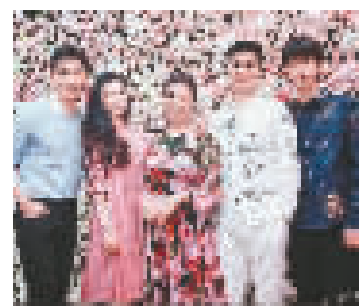
范冰冰昨日晒出全家福。

前晚，第31届金鸡奖颁奖典礼在呼和浩特举行。当晚最幸福的人莫过于范冰冰，在36岁生日凌晨接受了李晨的求婚，又在当晚获得金鸡奖最佳女主角，可谓双喜临门。她主演的电影《我不是潘金莲》也是本届金鸡奖的最大赢家，一举拿下最佳导演、最佳女主、最佳男配三大奖项。昨天，范冰冰在微博晒出全家福，爸爸妈妈、弟弟和李晨一起出镜，笑称自己“人生完美”。