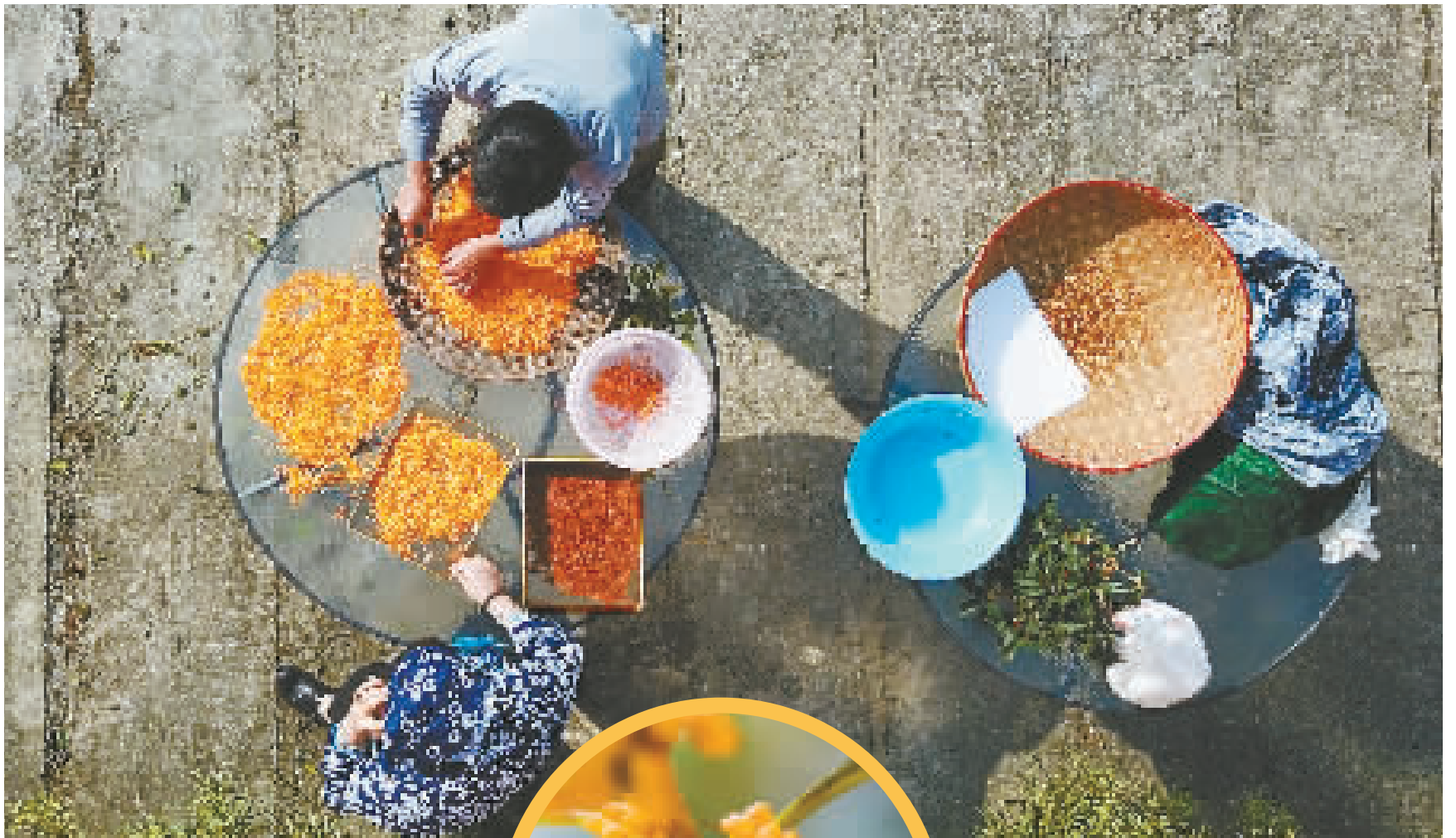
把掺杂在桂花里的树枝、树叶清理掉。