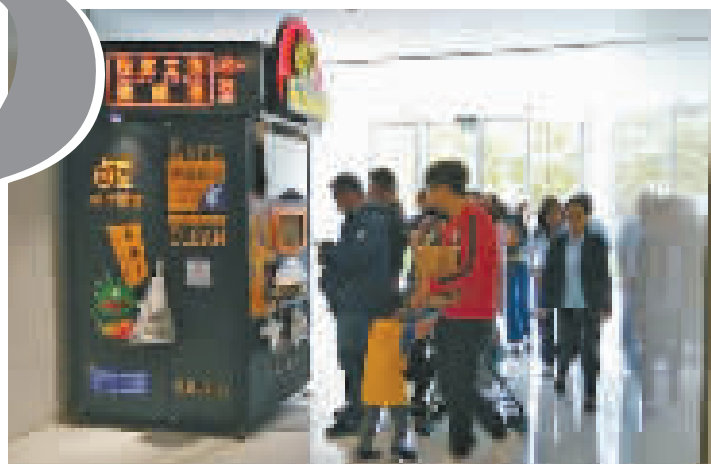
一台“卤豆热汤鲜面”自动贩售机前,排着十几位顾客。

在全国各地纷纷出现无人便利店之后,近日上海出现的“无人面馆”迅速在网上走红,不过,因为涉超范围经营,10月27日,在上海投放的3台“无人面馆”已被全部叫停,正当大家为之疑惑之际,又有消息传来,该“无人面馆”重新评估审核后,获得“准生证”的希望很大。