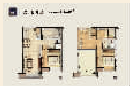
(建筑面积约104㎡户型图)

恒大城市之光,此次重磅推出的主力户型为建筑面积约104㎡的装修复式大三房,产品虽定位为公寓,但居住舒适度并不亚于住宅。整个户型全明设计,三房两厅两卫,约4.5米层高,买一层享两层,对比住宅拥有更高的使用率。客厅挑空,落地窗景,使得整个空间更是处处彰显阔绰和大气。值得一提的是,该产品采用全屋成品装修,后期交付即可轻松入住,省时省心省力。