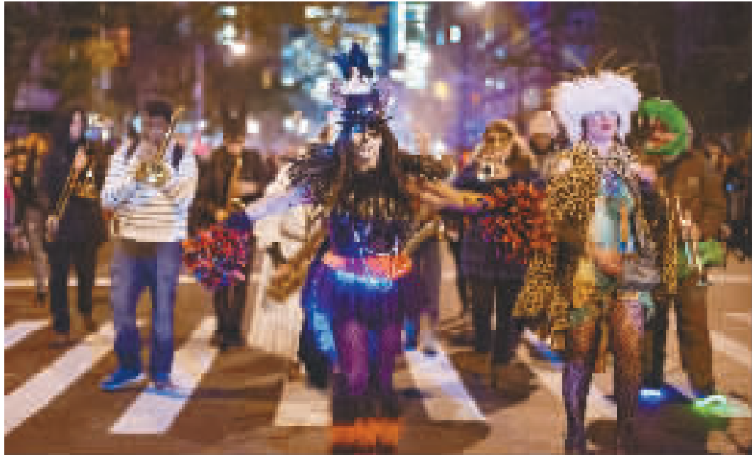
当晚,人们在纽约参加万圣节大游行。