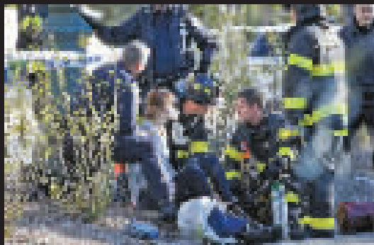
一名女子在袭击事件现场附近接受救助。