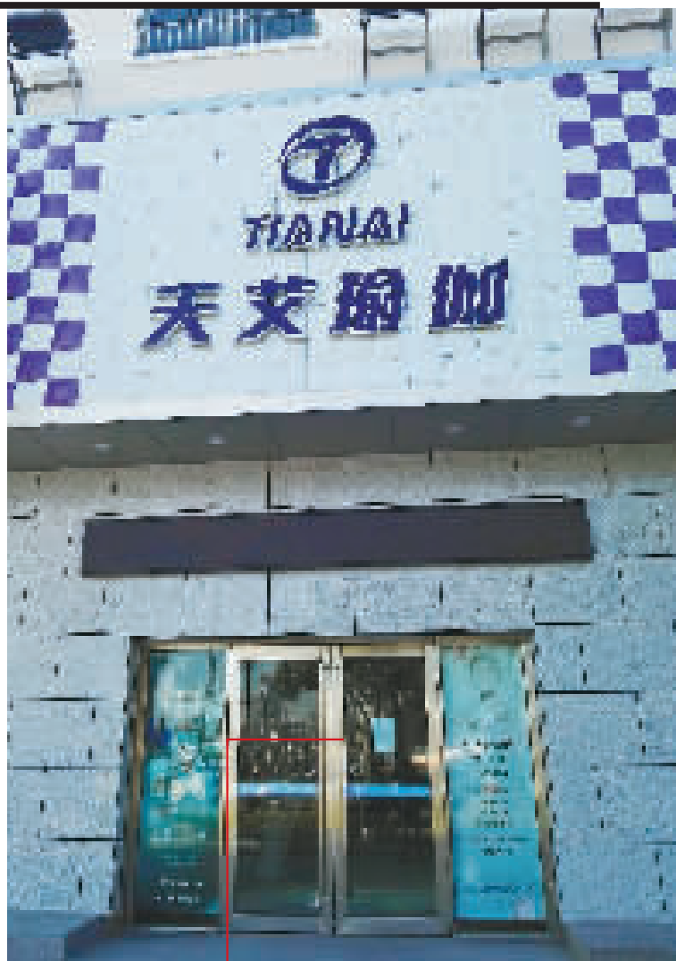
天艾瑜伽会馆大门紧锁。

“天艾瑜伽的会员很多,我们不可能全部接收,毕竟我们首先要满足老客户的需求,场地和时间都有限。”该工作人员表示。