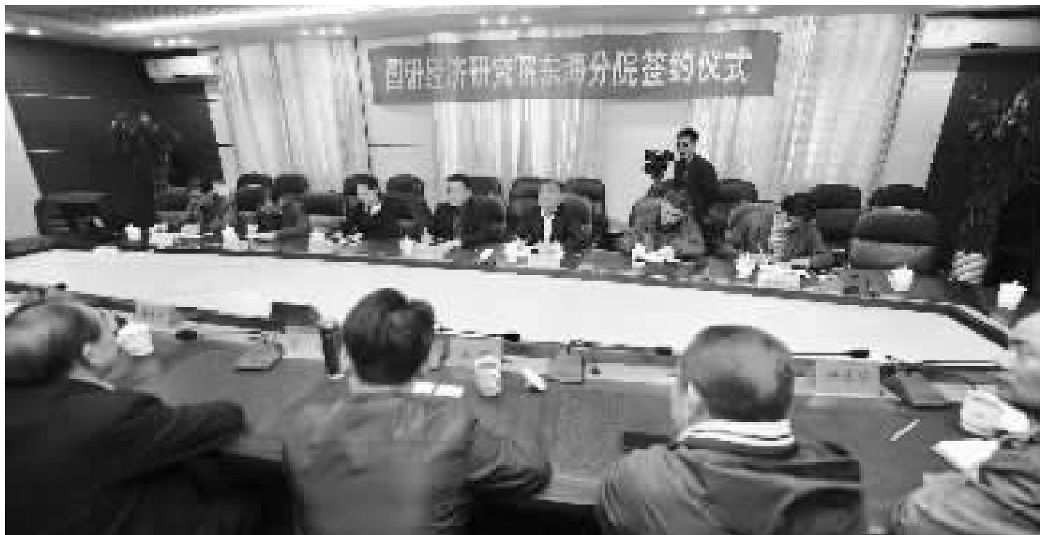
国研经济研究院东海分院签约仪式昨天举行。