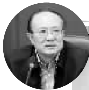
国务院发展研究中心党组成员、办公厅主任、著名经济学家余斌为商报题词。