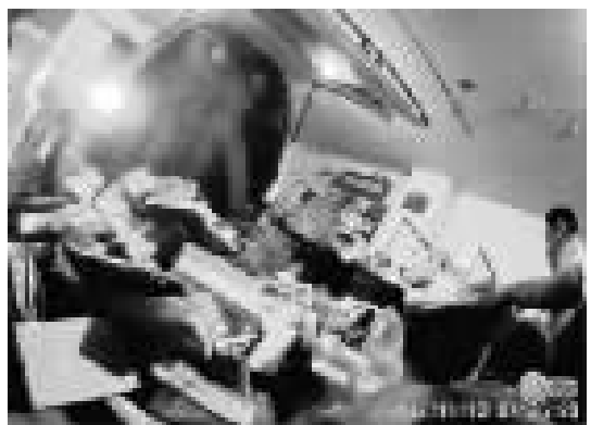
踢:快递员在面包车上脚踢卸包裹。