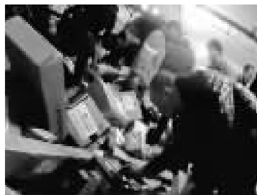
吃:工作人员从破损的包裹中拿出食物吃起来。