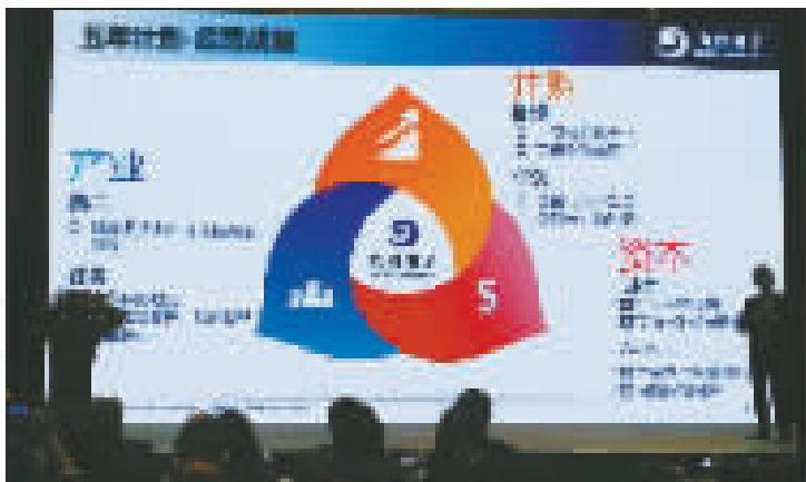
均胜集团五年计划之经营战略。

主营核心业务涵盖智能驾驶、安全驾驶和新能源汽车电子等附加值较高的领域，已经成为全球汽车电子领域一股强大的中国力量。